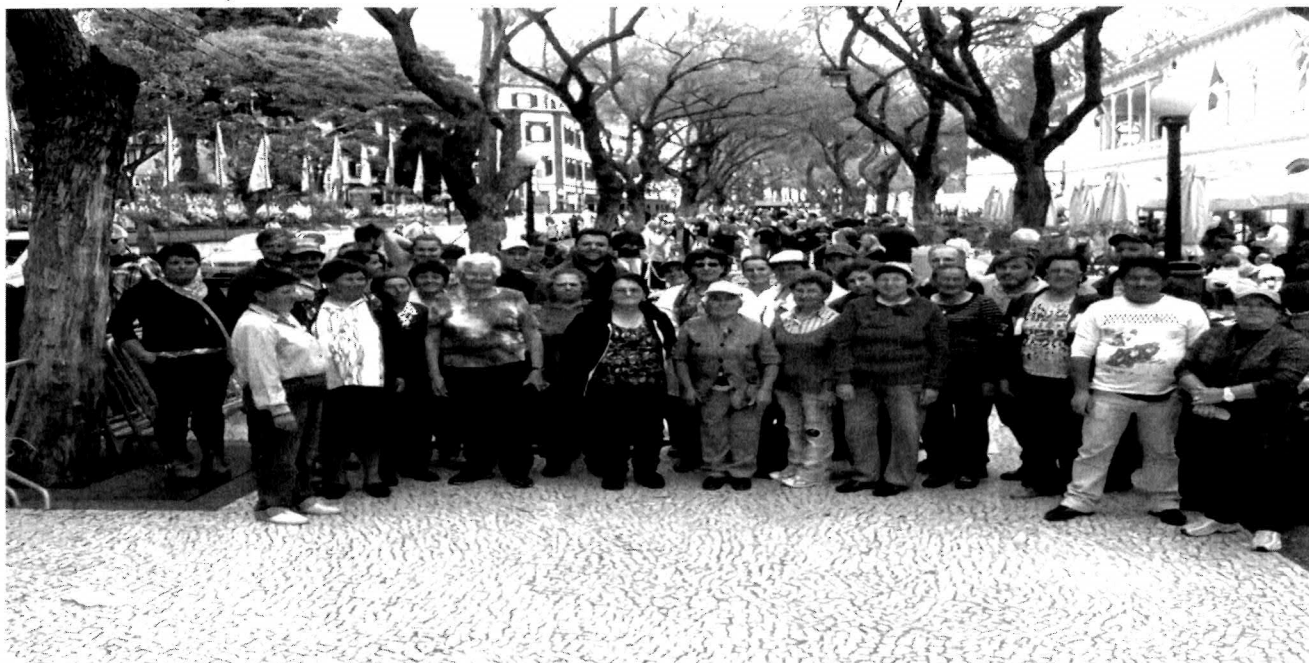
Equipa de elaboração de Tapetes Florais